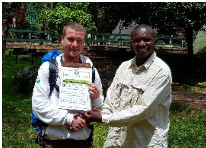
Überreicht vom Tour-Guide