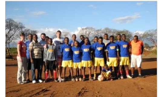
Unterstützung von Straßenkindern mit Sportausrüstung und finanziellen Mitteln