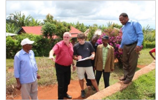
Bau eines Speisesaal und Lehrerzimmer; Erweiterung der Stromversorgung und Wasserinstallation