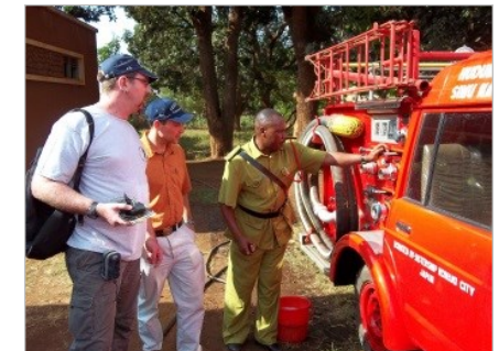
Unterstützung mit feuerwehr- technischer Ausrüstung