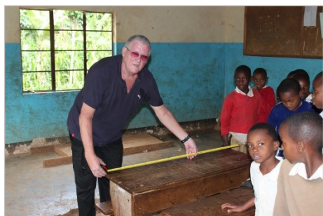
unfertiger Klassenraum / Level 3

Wir wollen die Schule bei der Ausstattung der Klassenräume mit Tischen, Bänken, Stühlen, Tafeln und der Renovierung und Modernisierung der Klassenräume unterstützen.