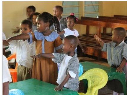
Patenschaften für 15 bedürftige Vorschulkinder