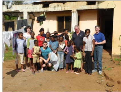
Unterstützung von 26 Waisenkindern; Schulgeld, Lebenshaltungskosten