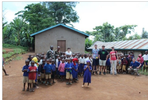
Ausstattung von Klassenzimmern; Versorgung mit Lehrmaterial